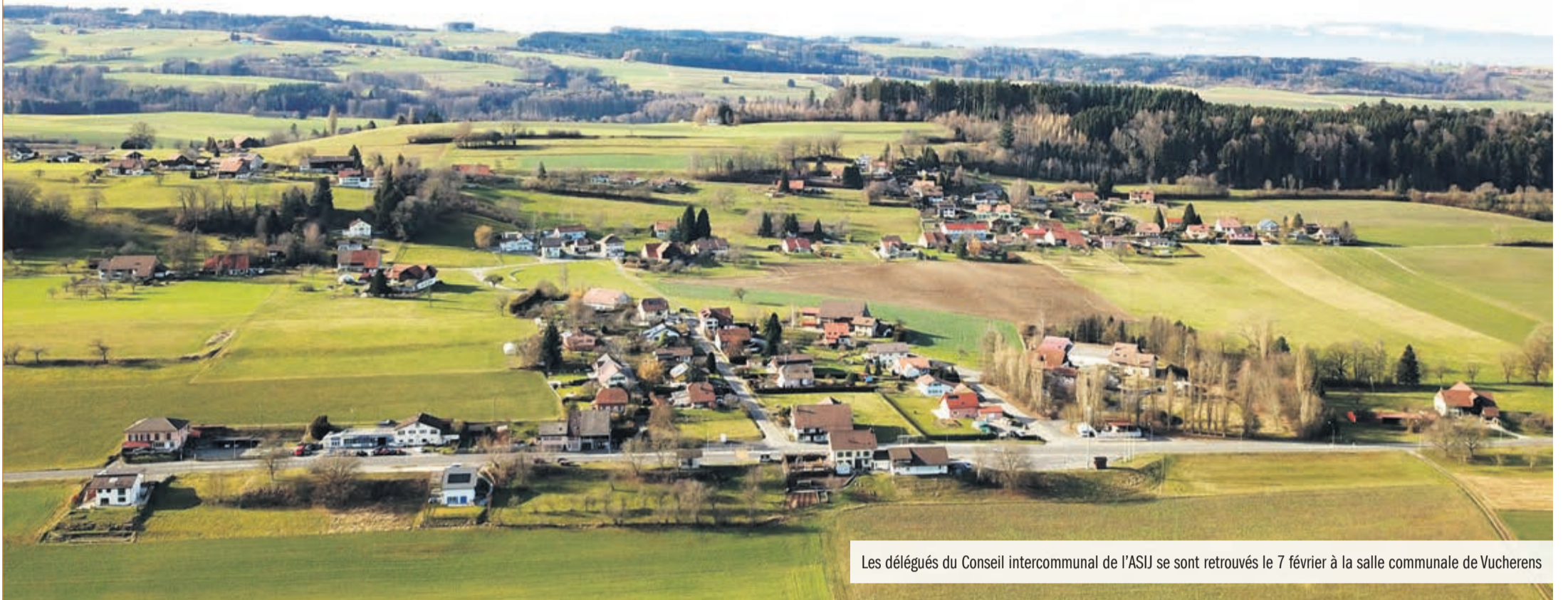
Les délégués du Conseil intercommunal de l'ASIJ se sont retrouvés le 7 février à la salle communale de Vucherens