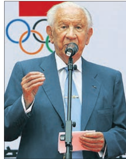
Juan Antonio Samaranch

Peut-être par le vœu de «sauvegarde» ce qui peut encore nous faire rêver... Eh! oui! puisque sur la planète sport on aime à rêver... Mais quel rêve?