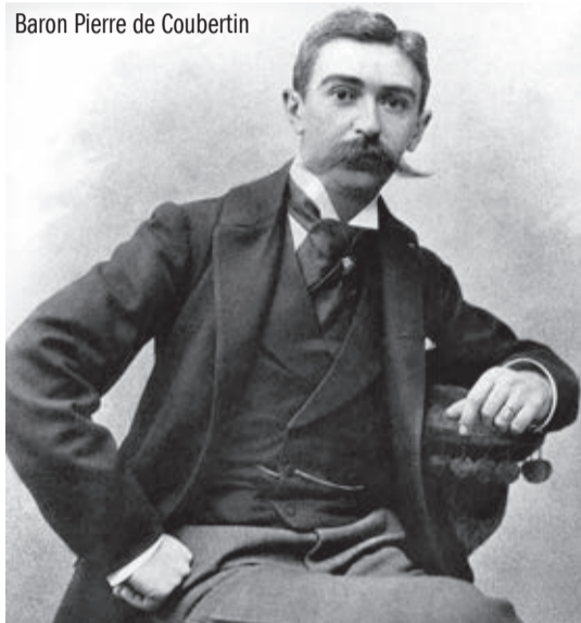
Baron Pierre de Coubertin

Demetrius Vikélas, premier président du comité international olympique