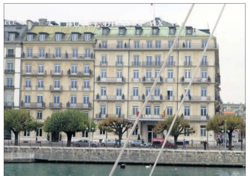
Hôtel de la Paix à Genève

- Alors, fit Cordey qui n'y croyait pas tellement, c'est sans espoir?