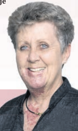
Monique Ryf Députée PS Oron-la-Ville

Parce que la solidarité doit être un principe fondamental dans notre société pour que celle-ci vive en bonne intelligence, je vous invite à voter OUI à l'initiative sure le remboursement des frais dentaires le 4 mars prochain.