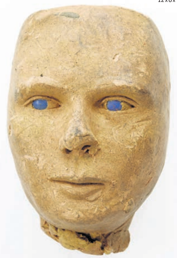
Photo: © Marie Humair, Atelier de numérisation - Ville de Lausanne Collection de l'Art Brut, Lausanne, n° inv. cab-11078