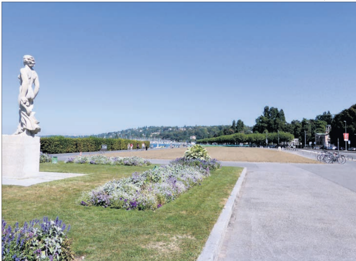
Quais de Genève