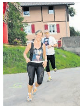
Cross des Z'Amoureux le 9 septembre

En outre, il y a aussi un parcours de walking (marche en français...) sur 5,3 km avec départ à 19h10.