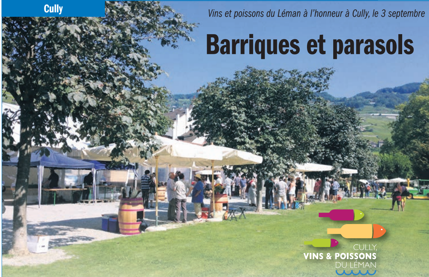
Vins et poissons du Léman à l'honneur à Cully, le 3 septembre