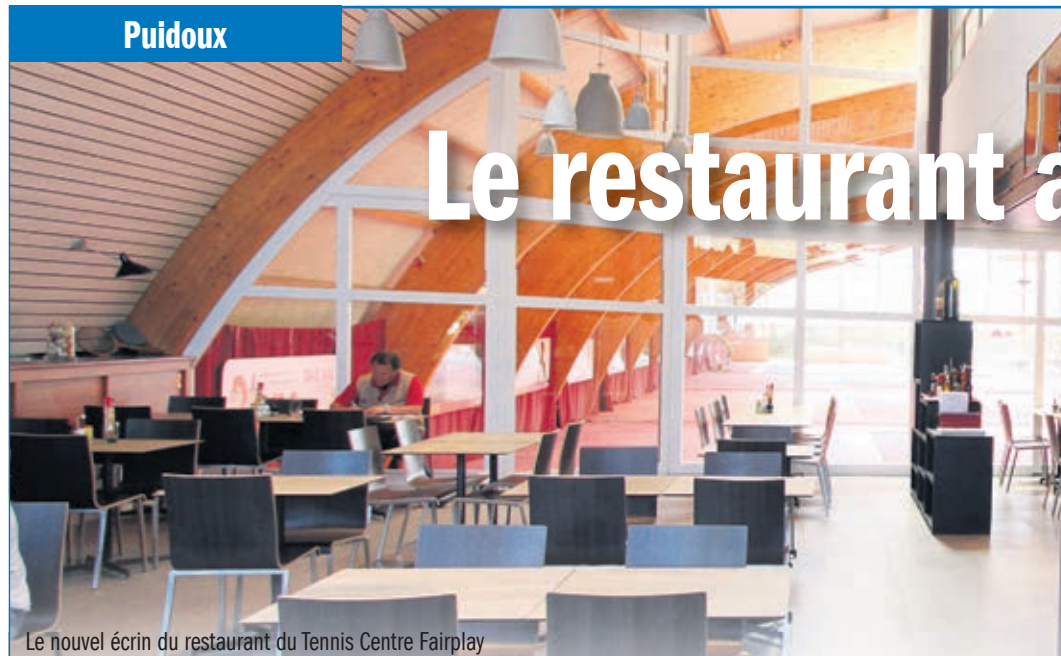
Le nouvel écrin du restaurant du Tennis Centre Fairplay

Le Tennis Centre Fairplay continue sa mue