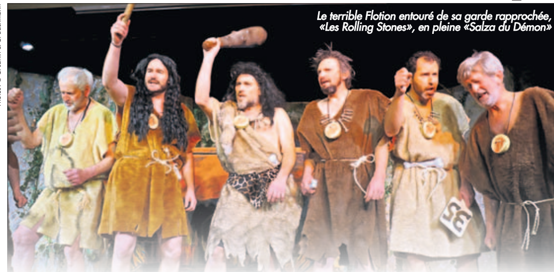
Le terrible Flotjon entouré de sa garde rapprochée, «Les Rolling Stones», en pleine «Salza du Démon»

La cuvée 2016 du spectacle joué par le chœur d'hommes L'Avenir de Forel (Lavaux) a rencontré un grand succès ces trois derniers week-ends. La troupe a joué à guichets fermés jusqu'à sa dernière représentation, samedi dernier. Retour sur quelques moments forts du spectacle.